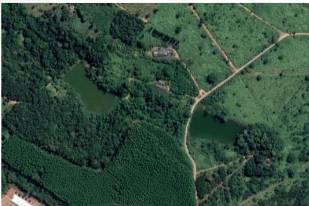
Imagem de satélite dos barramentos existentes.