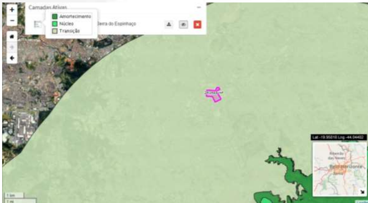
Imagem 04 – Reservas da Biosfera

Em consulta ao IDE- Sisema, verificou-se que o empreendimento encontra-se inserido em área de transição da reserva da Biosfera da Serra do Espinhaço.