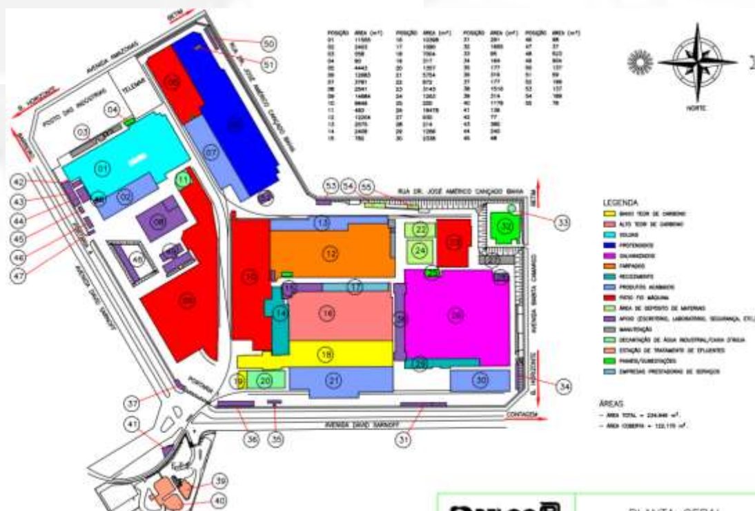
Imagem 02 – Descrição das áreas da empresa