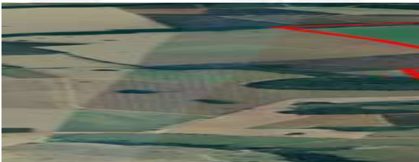
Figura 1. Delimitação da área do empreendimento.

Quanto aos resíduos sólidos, os recicláveis são comercializados com empresas ou cooperativas de recicladores ou doados a entidades beneficentes, os não recicláveis são destinados para a coleta pública do município de Patrocínio, os resíduos orgânicos vão para a compostagem na propriedade, os resíduos perigosos/contaminados são recolhidos por empresa especializada e licenciada para receber e destinar resíduos classe I, assim como os resíduos veterinários (embalagens de medicamentos, seringas, etc). As embalagens vazias de defensivos são armazenadas em galpão adequado e posteriormente entregues no ponto de coleta autorizado em Patrocínio.