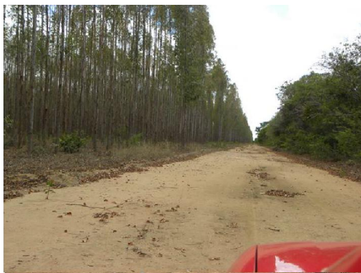
Figura 01. Área de silvicultura.

Relatório fotográfico do empreendimento do Fazendas Boqueirão, Das Araras, Santa Rosa, Jatobá, Mutuquinha, Angélica, Santa Helena, Capão Grande, Vereda I, Vereda II, São Benedito, Santa Clara, Forquilha Grande, Santa Maria, Tambaú e Porto Novo – Gerdau Aços Longos S.A.