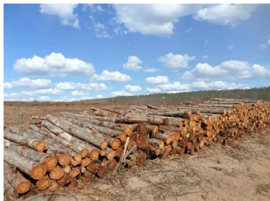
Figura 02. Áreas de exploração do empreendimento.