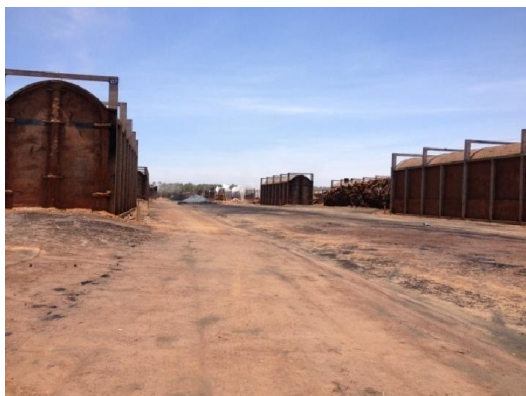
Figura 03. Planta de carbonização.