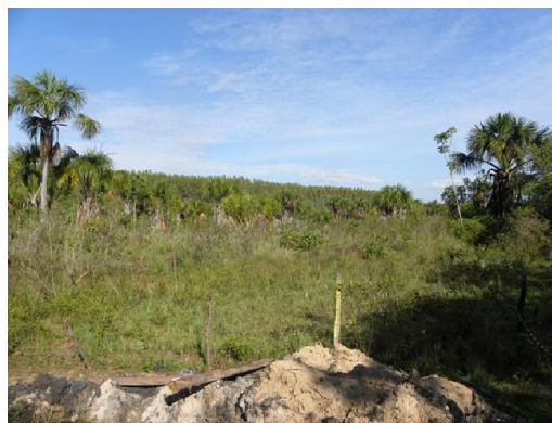
Figura 04. Área de reserva legal.