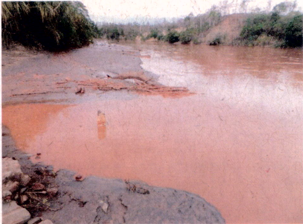
Foto 2: Rejeitos de minério de ferro depositado no leito do Rio doce.