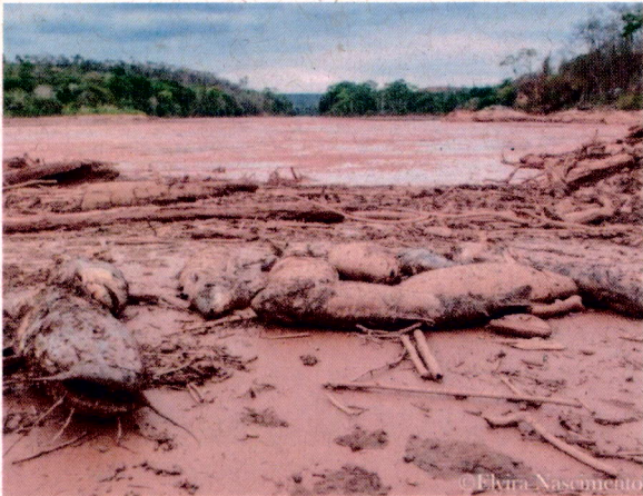
Foto 1: Peixes mortos a época da chegada da lama no município de São José do Goiabal com algumas galhadas arrastadas de outros lugares.