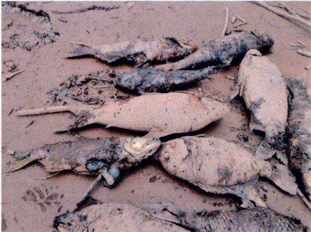
Foto 2: Peixes mortos a época da chegada da lama no município de São José do Goiabal.