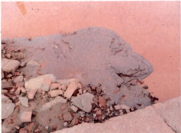
Foto 1: Rejeitos de minério de ferro depositado no leito do Rio doce.

PONTO 1: 19°58'23.28"S 42°38'36.62"O (Balsa da Arcelor Mittal)