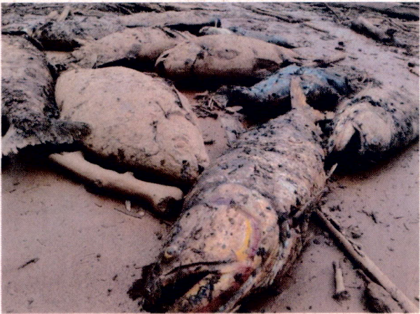
Foto 3: Peixes mortos a época da chegada da lama no município de São José do Goiabal.