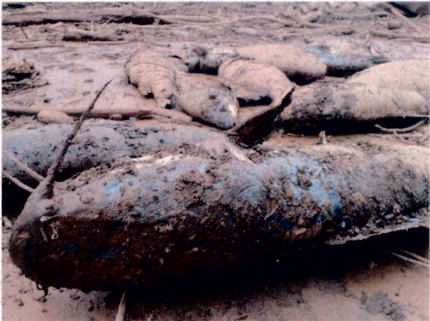
Foto 4: Peixes mortos a época da chegada da lama no município de São José do Goiabal.